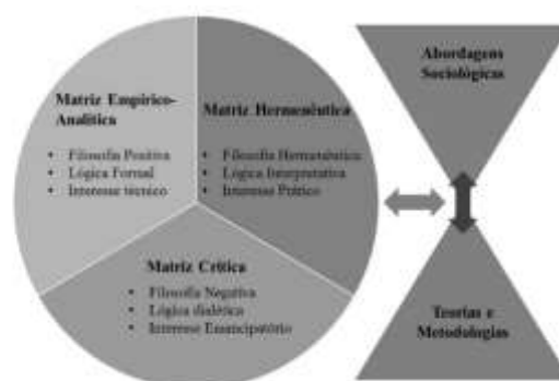
Figura 1: Círculo de matrizes epistêmicas, abordagens sociológicas, teorias e metodologias.