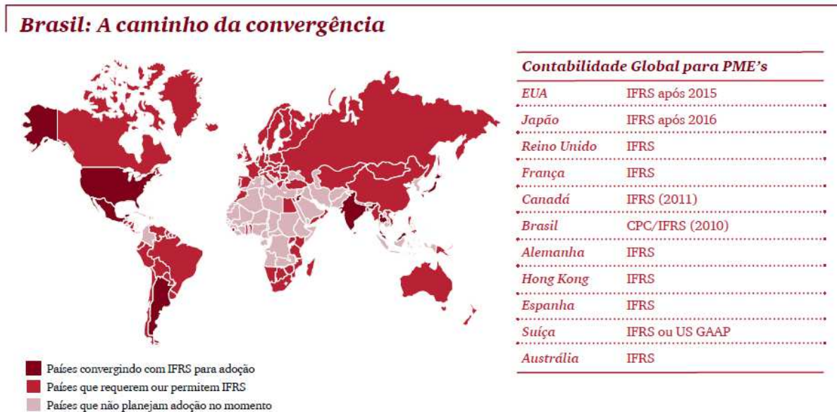
Quadro 1: Brasil: A Caminho da Convergência.