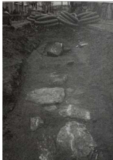
Figura 6 – Alicerce encontrado durante a escavação.

Para essa reforma houve muitas pesquisas preliminares para determinar o ponto onde poderia ter sido o da igreja do Rosário. As obras tiveram início no dia 19 de março de 2008, e com o início das escavações houve a descoberta de possíveis vestígios da base da estrutura da antiga igreja da irmandade, porém um tempo depois, foi identificado que se tratava de um alicerce do casarão construído após a igreja.