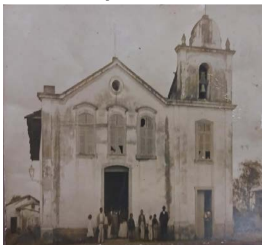
Figura 3 – Fachada da Igreja do Rosário dos Homens Pretos, com seus fiéis aproximadamente no ano de 1900.

Há muito pouco descrito referente aos traços arquitetônicos da igreja, porém com base em fotografias, podemos analisar sua fachada, e alguns detalhes de seu interior.