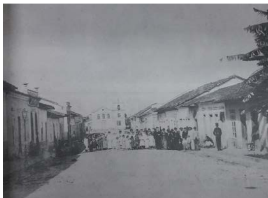
Figura 2 – Igreja original.