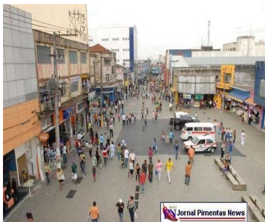
Figura 8 – Vista da Pintura no piso da Rua Dom Pedro II.

Em 27 de agosto de 2007, foi decretada a lei nº 6.282 que dispõe a criação de um monumento em memória aos escravos enterrados no antigo cemitério da Rua Dom Pedro II. Ela se baseia em uma pintura no chão em preto, e a implantação de uma placa.