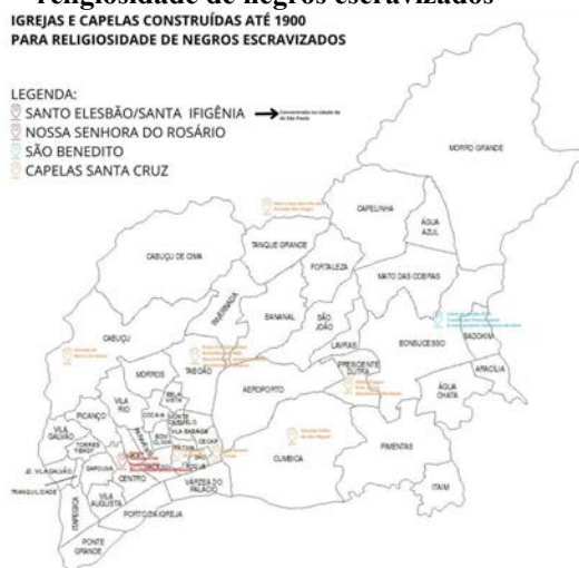
Figura 1 – Igrejas e Capelas construídas até 1900 para religiosidade de negros escravizados

O branqueamento e sua ideologia foram criados a partir de novos desafios religiosos, políticos, culturais e até científicos dado a consequência da separação gradual da igreja católica e o estado a partir do ano de 1870, passando poderes que antes eram responsabilidade da igreja (ex. sepultamentos e casamentos) para o Estado, resultando no enfraquecimento em atuações diretas da igreja com a população.