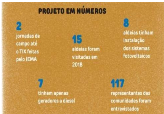
Figura 6 - número de aldeias que foram visitadas que tem acesso a energia elétrica, sendo a diesel, ou sistemas fotovoltaicos.

geradas antes pelos geradores a diesel utilizando dados da ANEEL e EPE como base de estudos juntamente os projetos Xingu Solar que mostra a dificuldade que era a logística da energia elétrica em região remotas e como a escolha da energia solar foi o mais adequado para ampliar o acesso a eletricidade, aumentar a formação técnica dos moradores dessa comunidade ribeirinha na utilização da energia elétrica solar. Conforme mostrado na figura 6, onde é possível observar o número de aldeias visitadas durante o projeto. Também pode ser observado na figura 7 em porcentagem quantas aldeias foram visitadas, e quantas tem ou não energia, sendo elétrica ou fotovoltaica.