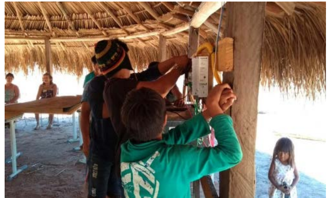
Figura 5 - Processo de instalação do sistema fotovoltaico nas aldeias.

Já na segunda fase, foi o processo de participação efetiva dos alunos em sistemas com apoio e supervisão da equipe LSF-IEE/USP, conforme observado na figura 5. Cada comunidade escolheu um lugar comunitário para a instalação do seu sistema (como escolas ou postos de saúde). A comunidade deveria fornecer o poste para fixação do gerador e estrutura para a instalação das baterias.