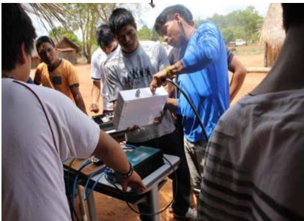
Figura 4 - Aulas práticas com instalação de placas solares e componentes.

As aulas práticas consistiram em montagens de sistemas isolados (conforme foi apresentado na figura 4), com os alunos sendo divididos em grupos, e sistemas sendo montados de 12 ou 24 Vc.c, com módulos, baterias, controladores de carga e inversores. É possível observar que a compreensão dos alunos ficava muito mais fácil quando participavam previamente de instalações de pelo menos um sistema. Também foi possível observar que, mesmo alguns alunos não sabendo ou não conseguindo se expressar em português, na prática a maioria demonstrava ter aprendido e entendido o conteúdo, ou seja, instalando e operando adequadamente componentes dos sistemas. (ZILLES et al., 2018).