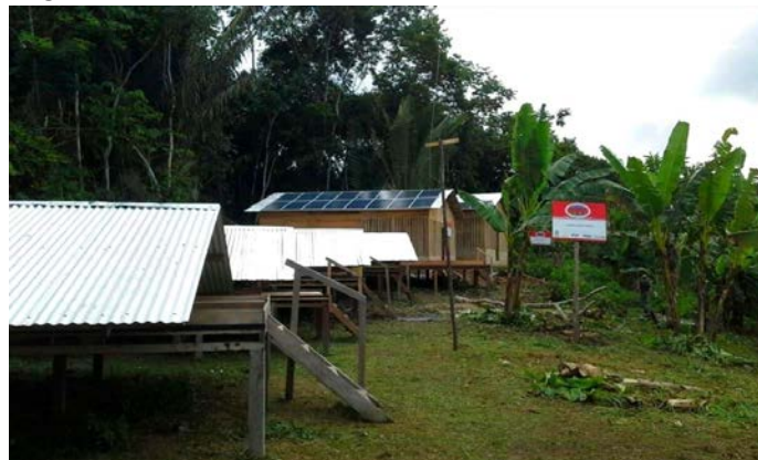
Figura 1 - Aldeia Raimundo do Vale com Painéis solares.

De toda energia utilizada no projeto, as placas solares têm a capacidade de abastecer 80% da energia, sendo apenas 20% sendo reforçada por geradores de energia, conforme apresentado na figura 1, onde há apenas uma das casas com placas de energia solar.