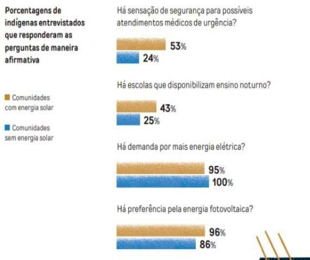
Figura 7 - Porcentagem de indígenas entrevistados, em relação a comunidades onde há energia solar.