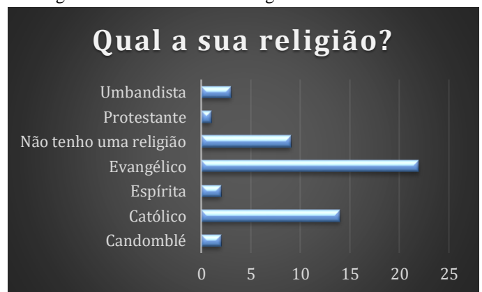
Figura 1 – Gráfico sobre a religião dos entrevistados.

Através de uma pesquisa enviada em redes sociais, 53 pessoas responderam de forma anônima sobre suas religiões e se em algum momento sofreram intolerância religiosa.