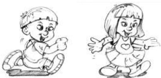
Figura 3: Personagens principais

A prototipação surgiu em meados dos anos 80 como a solução para o problema da análise de requisitos. Consiste em uma simulação das telas de uma aplicação, que permite ao usuário visualizar a aplicação antes de seu real desenvolvimento. Protótipos ajudam o usuário a ter uma idéia de como o sistema será e facilita a tomada de decisões