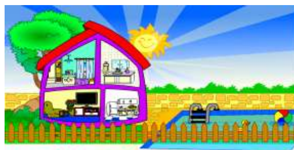
Figura 5: Interface onde ocorre a escolha do ambiente da casa a ser explorado

Ao optar por “jogar” é exibida a interface em que a criança pode escolher qual ambiente de uma casa deseja explorar (Figura 5), ou seja, é visualizada uma imagem contendo um corte transversal de uma casa com todos os ambientes do jogo (quarto, sala, cozinha, banheiro e quintal).