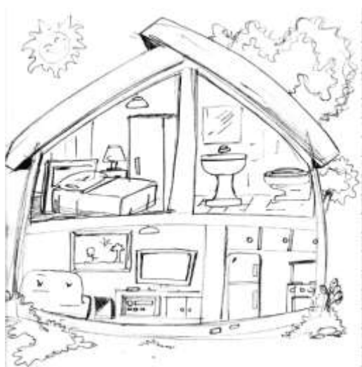
Figura 2: Esboço da tela inicial do ambiente.

O cenário principal consiste em uma casa subdividida em cinco ambientes (Figura 2): a saber: quintal com piscina, sala, cozinha, quarto e banheiro. Para tornar o ambiente virtual mais atrativo para crianças com SD, o personagem (ou seja, o avatar) foi gerado de modo a apresentar características físicas dessas crianças (Figura 3).