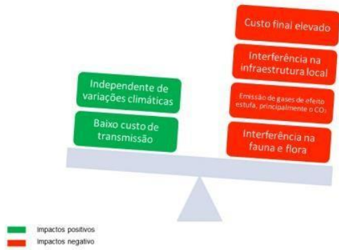
Figura 3 – Impactos consequentes de geradoras hidrelétricas