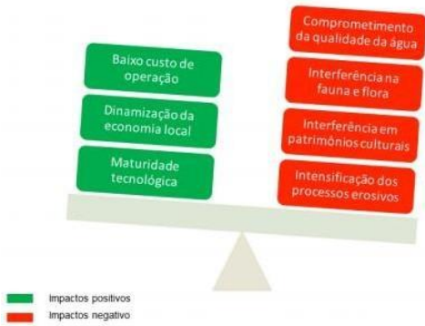
Figura 4 – Impactos consequentes de geradores termoeletricos e gás natural