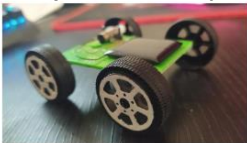
Figura 7 – Protótipo de veículo movido a energia fotovoltaica