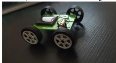
Figura 6 – Protótipo de veículo movido a energia fotovoltaica

Assim, pode-se concluir que projetos de geração fotovoltaica são os que possuem impactos socioambientais negativos menores e demonstram qualidades elevadas.