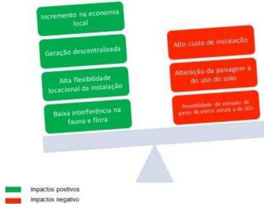
Figura 5 – Impactos consequentes de geradores solar fotovoltaicos