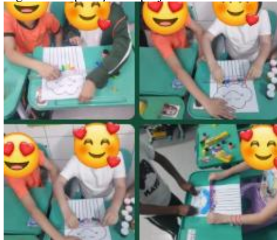
Figura 1 – Aplicação do projeto.

Durante a aplicação do projeto, observou-se grande interesse e participação das crianças em todas as etapas. A experiência de produzir o arco-íris com água, espelho e lanterna despertou surpresa e encantamento, possibilitando compreender, de forma prática, como a luz branca se decompõe em várias cores. As crianças relacionaram o experimento com fenômenos do cotidiano, como o arco-íris após a chuva, e conseguiram nomear e ordenar corretamente as sete cores.